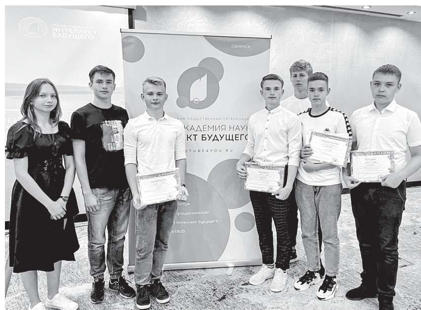
На конференции «Шаги в науку - юг»