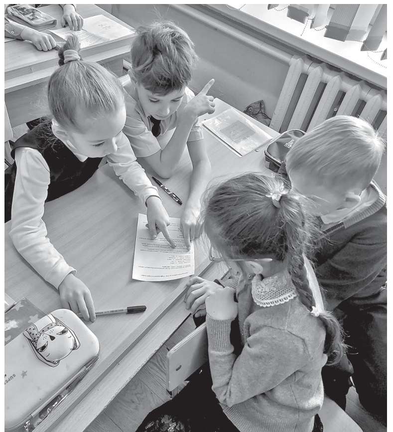
Юные гимназисты познают свой край