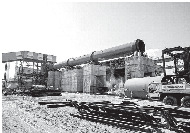
Завод «Оренбургский пропант» откроет в Новотроицке более 1200 рабочих мест на новой линии orenburg-gov.ru

Если заказчик обнаружит в Реестре поставщика, с которым заключен контракт, или производителя продукции, ему следует внимательнее отнестись к оценке качества принимаемой продукции и, при необходимости, провести лабораторную экспертизу.