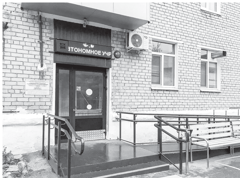
Обновленная входная группа отделения дневного пребывания и сопровождаемого проживания инвалидов