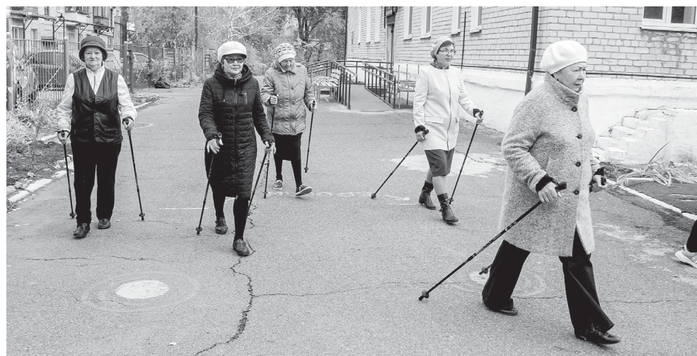
Получатели социальных услуг из группы дневного пребывания на прогулке

щего размера; усиление марша лестницы первого этажа для эффективной эксплуатации гусеничного подъемника); адаптация с учетом нужд маломобильных граждан санитарно-гигиенического помещения (расширение помещения санузла и дверного проема, установка дверной коробки с дверью надлежащего размера с ручкой П-образной формы и дверным доводчиком). На сегодняшний день практически все эти работы выполнены и соответствуют всем требованиям, о которых говорится в СНиП 35-01-2001 «Доступность зданий и сооружений для маломобильных групп населения».