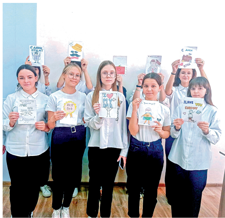
Мастер-класс в школе №3