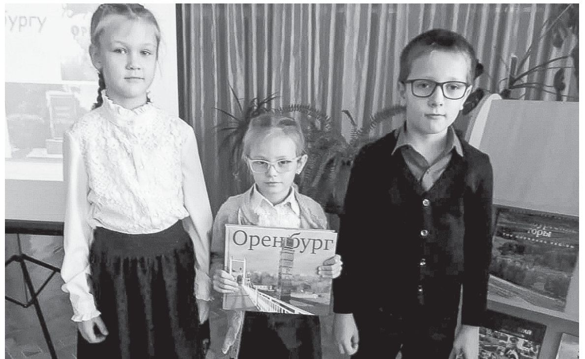
Ребята из школы №6 на занятии внеурочной деятельности «Мое Оренбуржье» в детской библиотеке