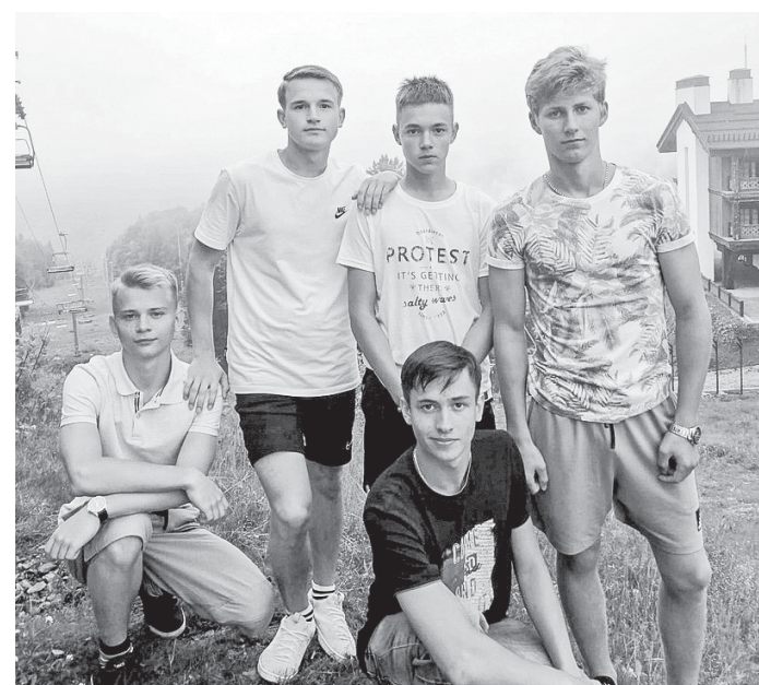
Гайские ребята на Красной поляне

Робототехника для меня сейчас не является приоритетом, но думаю, эти знания и навыки пригодятся в вузе и для дальнейшего участия в проектах, а может и для написания дипломной работы.