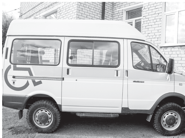
Новый «Соболь», приобретенный на субсидию, для подвозки пожилых людей и инвалидов