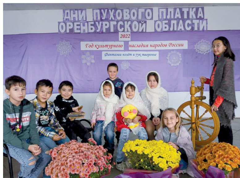
В Нововоронежском центре досуга