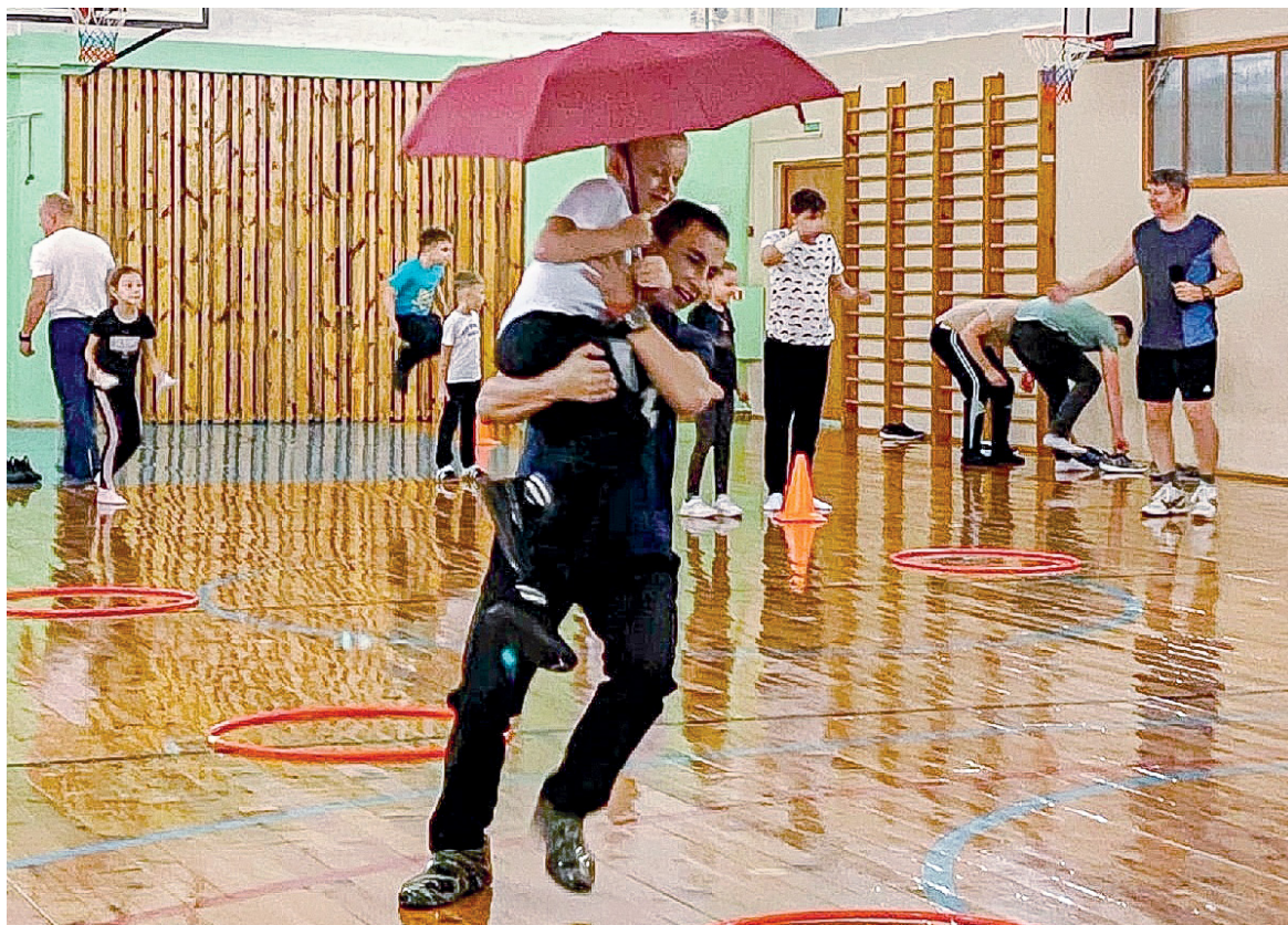
«Веселые старты» в школе №8