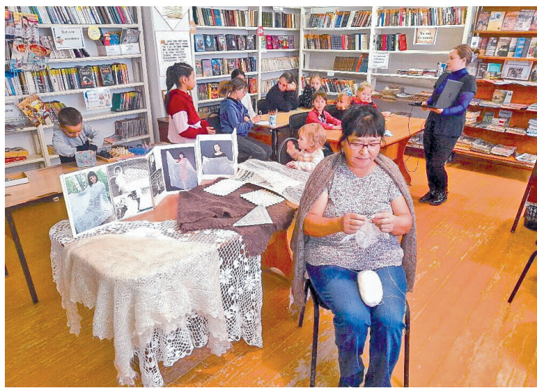
Тайны пуховых узоров