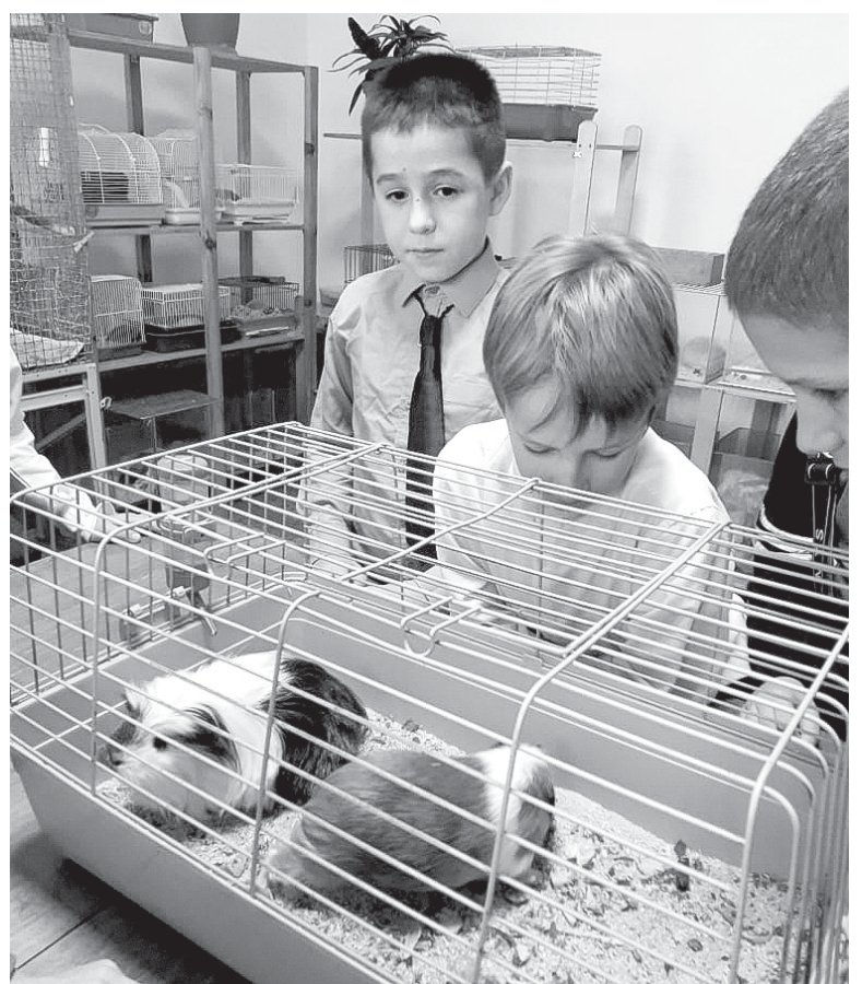
Третьеклассники из школы №4 на экскурсии в ЦДТ «Радуга»