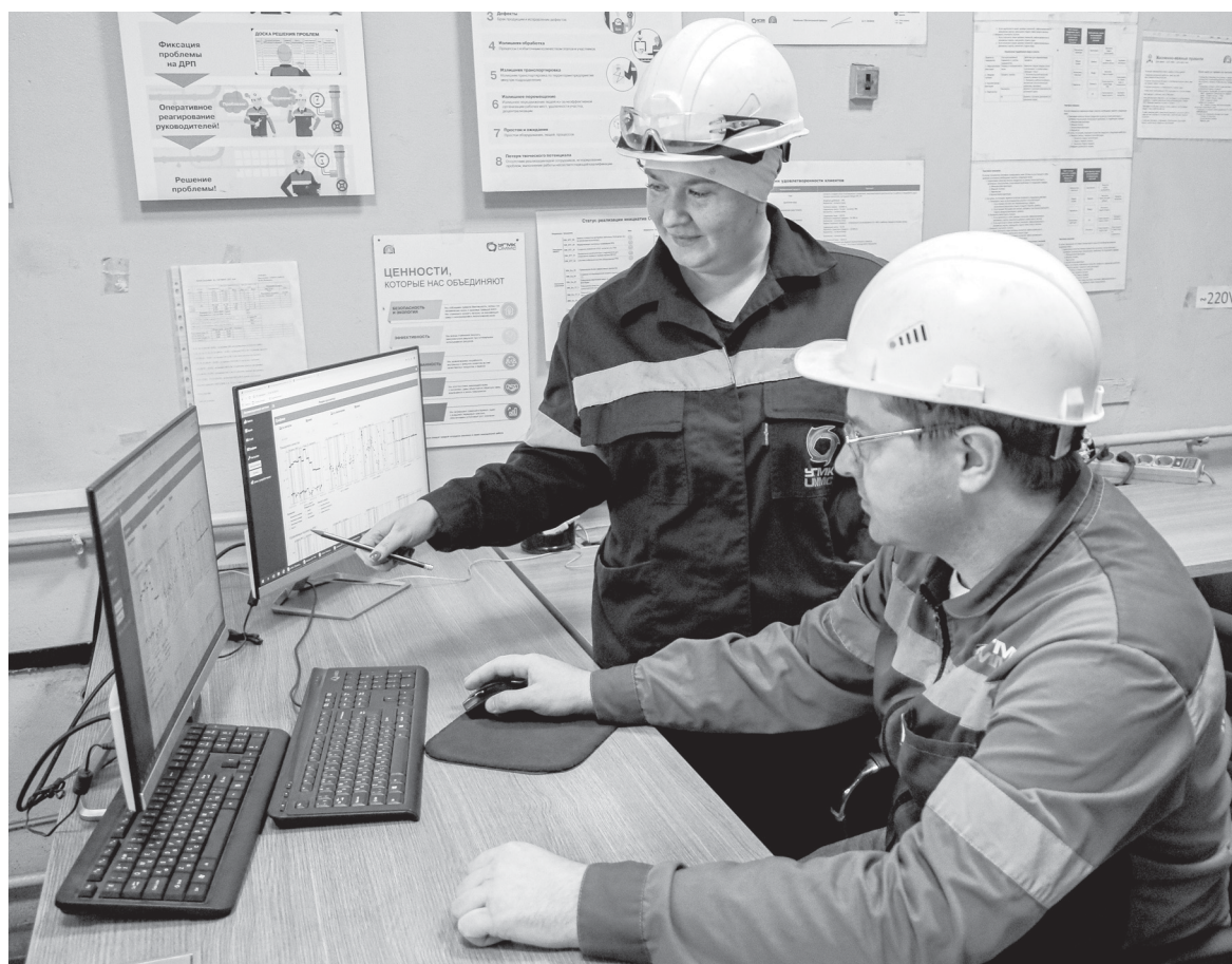
На мониторах - процесс флотации в режиме реального времени

- Цель внедрения такой многофункциональной цифровой системы – стабилизация и повышение эффективности процесса обогащения руды. Применение цифрового советчика в сложном процессе обогащения значительно стабилизирует флотацию и дает возможность прогнозировать качество получаемого концентрата. Цифровой советчик помог минимизировать потери меди.