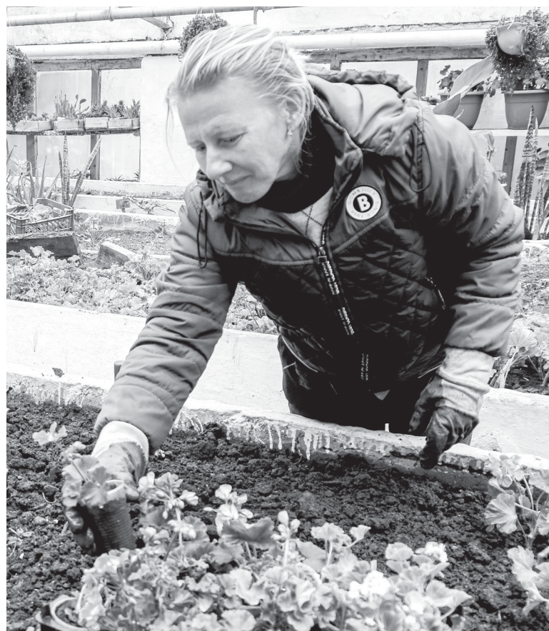
Много работы у озеленителей сейчас и в теплице

Много работы у озеленителей сейчас и в теплице. Октябрь - самое время подготовить к новому посадочному сезону помеще-