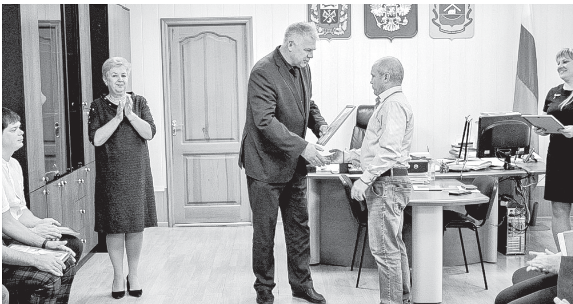
Торжественная церемония награждения победителей в администрации округа