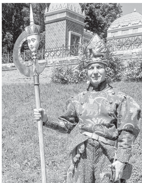
Гвардеец Летучий корабль

- Мне очень нравятся костюмированные или исторические проекты. В прошлом году я снимался в много-