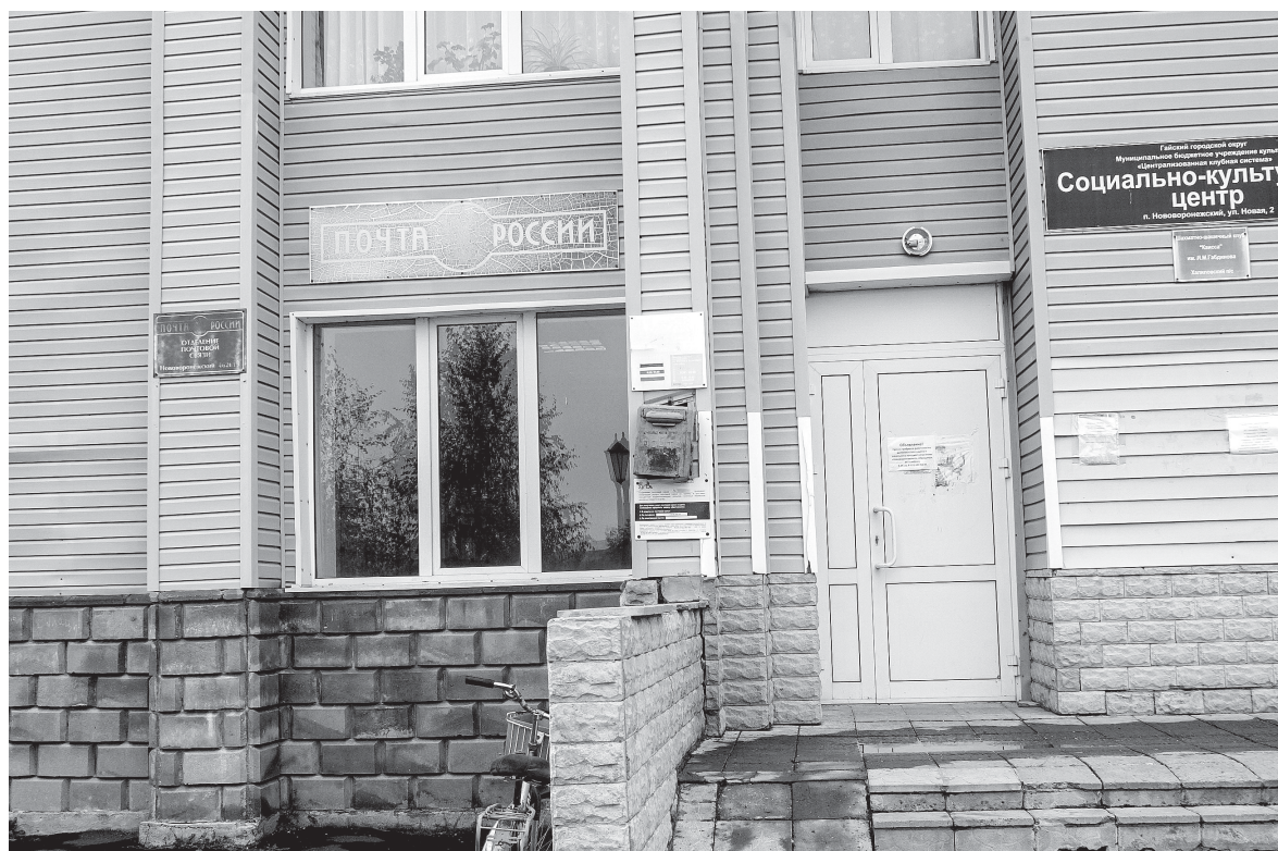
Почтовое отделение в поселке Нововоронежском - на замке

- Мы десятилетиями привыкли выписывать газеты, из которых узнаем свежие новости. В их числе и «Гайская новь», - поделилась своими переживаниями группа нововоронежцев, которых нам удалось встретить в центре поселка. - А сегодняш-