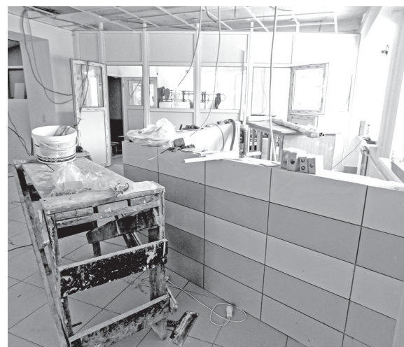
Старую плитку сменил новый керамогранит