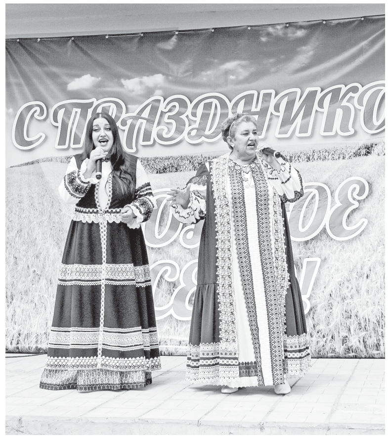
Семейный дуэт «Вдохновение»

- Стараясь попробовать свои силы во всех гранях этого творчества. Например, в составе ансамбля «Любава» - это больше народные песни. В репертуаре дуэта «Вдохновение» есть и плоды народного творчества, и эстрадные песни, и патристические композиции в стиле легкого рока, то есть что-то наподобие Ольги Кормухиной, и песни на иностранных языках. Но, на мой взгляд, лучше других мне удается лирично-драматический образ, когда я в песенной форме рассказываю какие-то грустные истории. Песни такого жанра