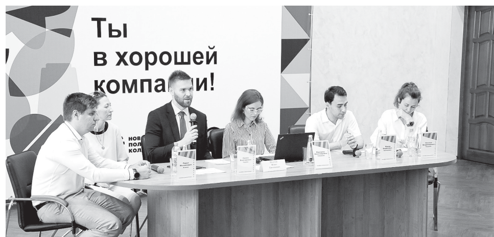
Комиссия Минпросвещения России высоко оценила ход реализации проекта «Профессионалитет» в Оренбуржье

На деловой встрече членов Правительства региона с узбекистанскими партнерами отметили, что Узбекистан является одним из ведущих внешнеторговых партнеров Оренбургской области. На долю республики по итогам 2021 года приходится 7,1% (207,7 млн долл. США), а за I квартал 2022