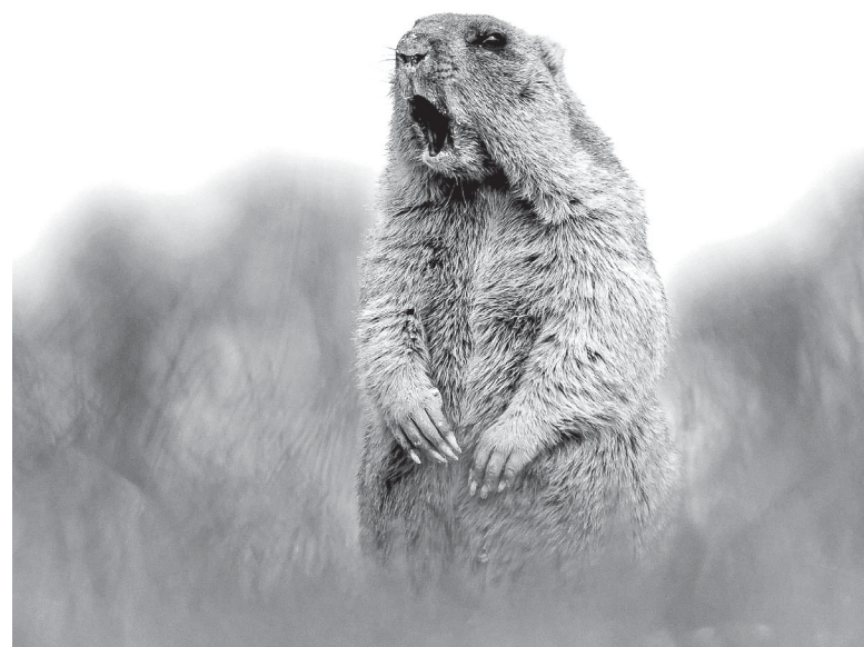
Не видно ли браконьеров?

Добавим, что обучение состоялось в рамках исполнения региональной программы противодействия коррупции в Оренбургской области на 2019-2024 годы, утвержденной постановлением регионального правительства от 28 июня 2019 года.