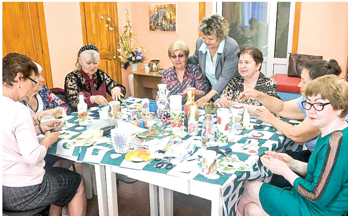
Проводим время с пользой для здоровья и души

Так говорят получатели социальных услуг отделения дневного пребывания граждан пожилого возраста и инвалидов комплексного центра социального обслуживания населения в г. Гае. Сегодня их более 50 человек. Все они довольны работой отделения: чутким и внимательным отношением специалистов, эффективностью и разноплановостью проводимых занятий и мероприятий.