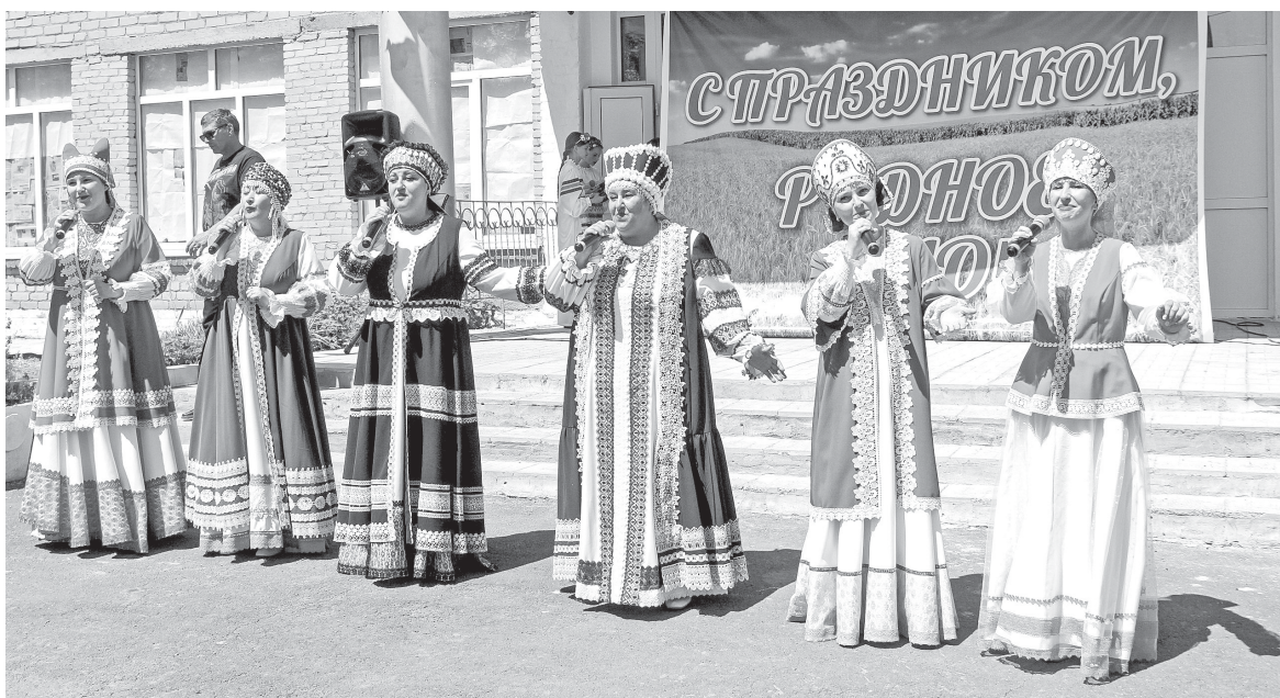
В составе ансамбля «Любава»