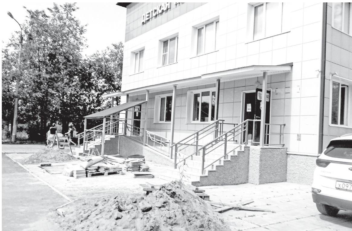
Ремонт на завершающей стадии