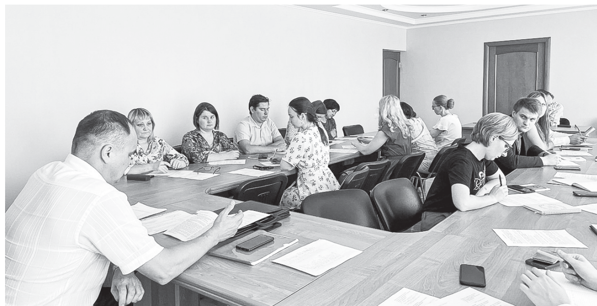
Учимся против коррупции

Если же добавить свой профиль в разделе под названием «Экоидеры», то ваши единомышленники узнают, что вы готовы помогать им в экологической работе. Этот же раздел поможет вам найти в регионе вашего проживания целое экологическое сообщество, где всегда будут рады новым участникам.