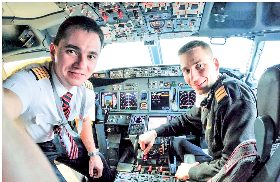
К полету готовы!

- Благодаря тому, что у меня были заметные успехи во время занятий в орском аэроклубе, перед поступлением в училище мне