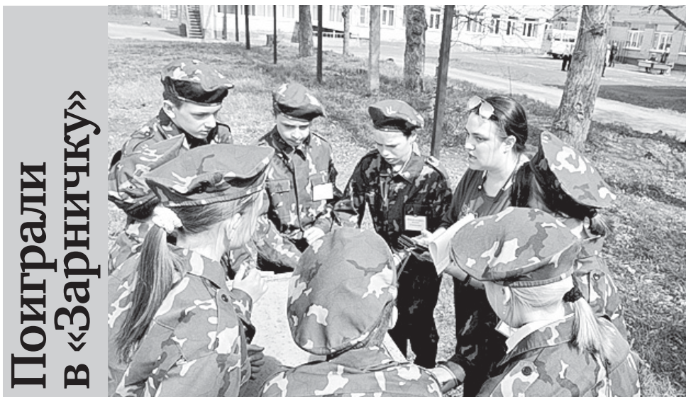
Поиграли в «Зарничку»

В конце минувшей недели в Гайском городском округе проходил муниципальный этап военно-спортивных соревнований «Зарничка», в котором приняли участие учащиеся общеобразовательных учреждений и юнармейские отряды.