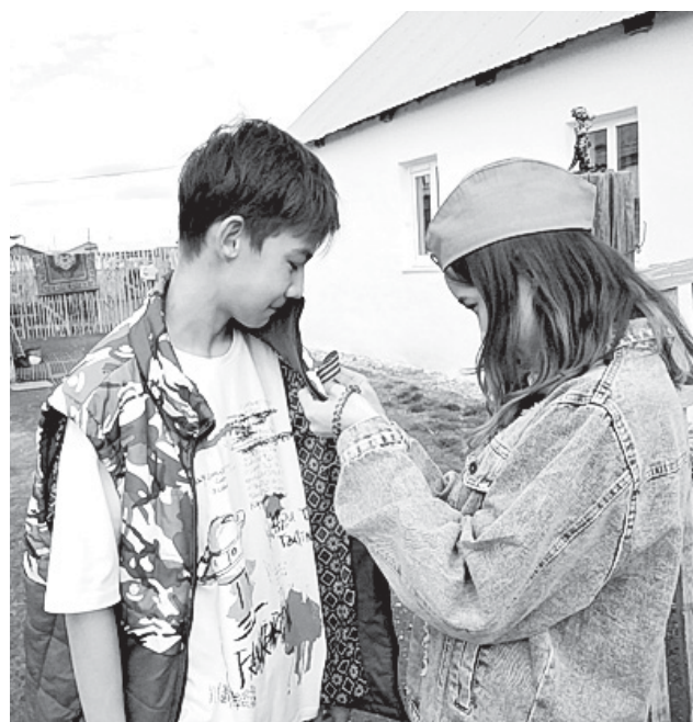
Георгиевская ленточка вручена

В Гае символ победы проходящим по улице горожанам вручали волонтеры Победы и учащиеся школы №6. Надо отметить, что гайчане с благодарностью принимали этот небольшой подарок и выражали готовность принять участие в торжественных шествиях и других праздничных мероприятиях, которые пройдут в муниципалитете 9 Мая.