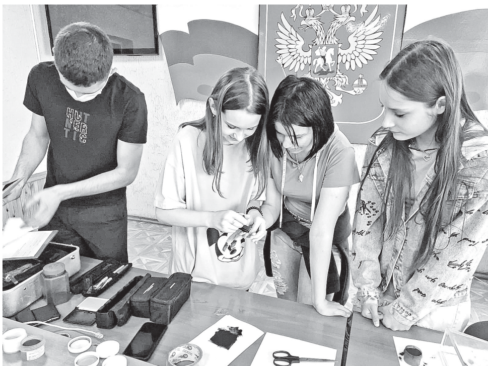
На короткое время ребята смогли почувствовать себя в роли полицейского

В конце встречи служители правопорядка пожелали своим юным гостям хорошей и продуктивной учебы, ведь совсем скоро им придется определяться с выбором будущей профессии. Вполне возможно, что кто-то из присутствовавших свяжет свою жизнь со службой в органах внутренних дел.