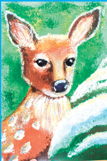
Олененок, нарисованный фантиками

В рамках недели культуры Г.В. Ко провела для своих учеников мастер-класс «Рисуем фантиками». Детские работы получились очень яркими и контрастными.