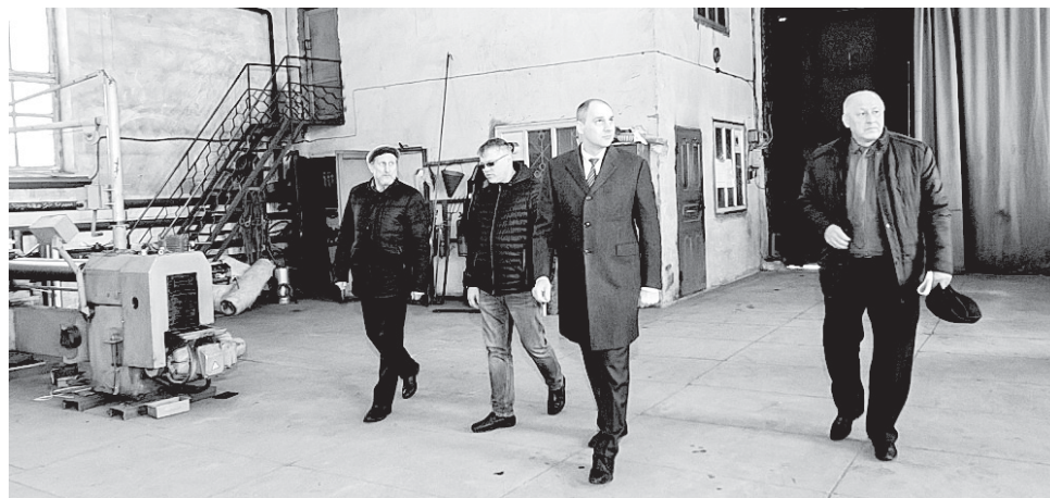
Глава региона Денис Паслер посетил производственную площадку и обсудил перспективы восстановления и развития Новосергиевского механического завода

На каждый гектар посевной площади в среднем по области предусмотрено внесение 13 кг действующего вещества минеральных удобрений. В течение зимы приобретено уже 30% планового объема удобрений, закупки продолжаются. На эти цели аграриям Оренбуржья предоставляются субсидии из регионального бюджета.