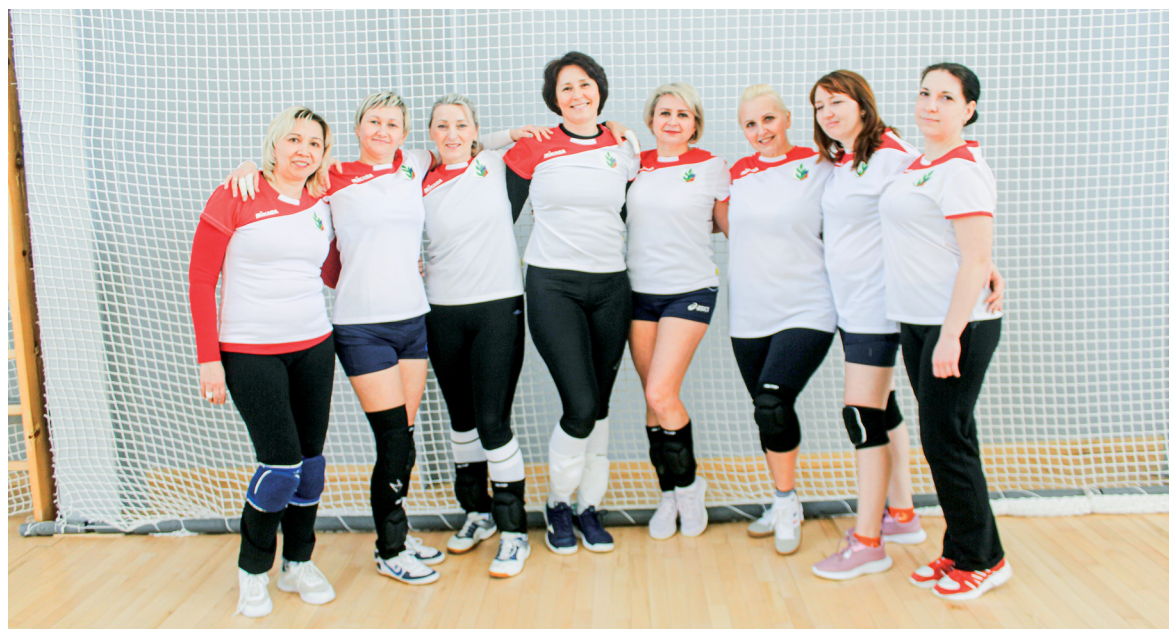
Гайские волейболистки - лучшие

Кроме этого, ребята совершили виртуальную экскурсию по г. Оренбургу, познакомились с его достопримечательностями и выдающимися людьми. Занятия оказали положительное влияние на детей, сформировали у них познавательный интерес к изучению родного края, умения и навыки самостоятельной исследовательской краеведческой деятельности.