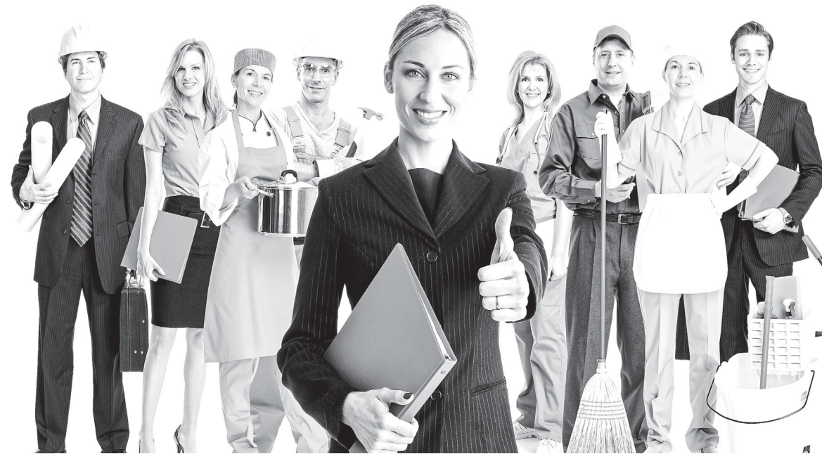
Работодатель заинтересован в квалифицированных кадрах

- Для того, чтобы человека поставили на учет по безработице и начали выплачивать ему денежное пособие, он должен быть зарегистрирован непременно по месту жительства, или в данном случае адрес регистрации значения не имеет?