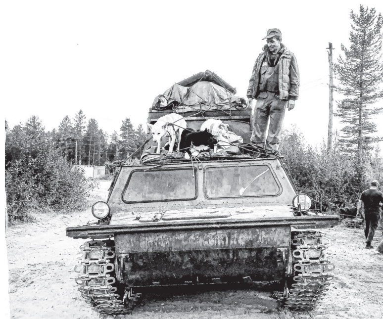
Якутия. Становой хребт. Так передвигаются геологи

предприятии. Тогда, занимаясь совершенно не своим делом, я поняла простую истину – человек несчастлив, когда его не радует работа. Но деваться было некуда. В то время каждый выживал, как мог. В 2003 году я вернулась в Гай и в 2004 году устроилась геологом в ГОК. Какое это было счастье! Я вновь занимаюсь любимым делом! В 2007 году