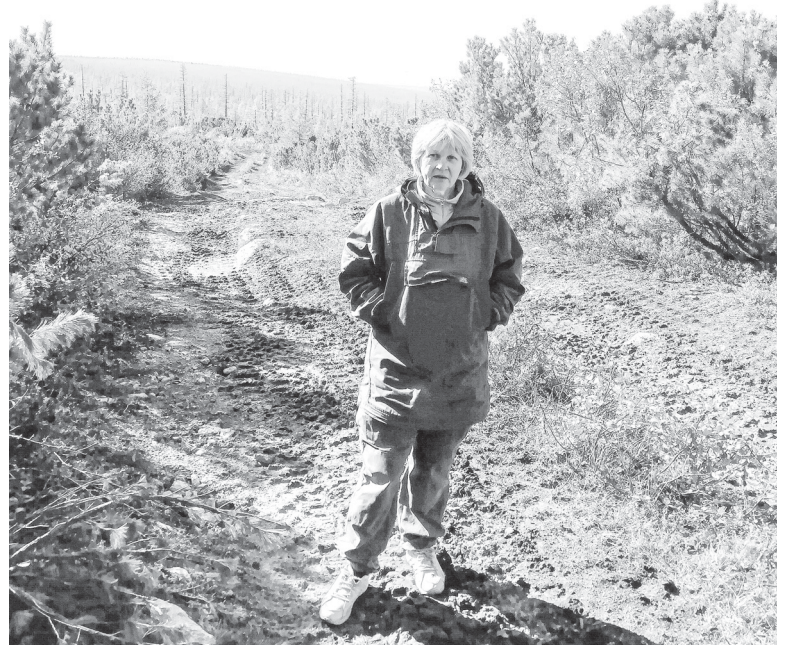
На Становом хребте