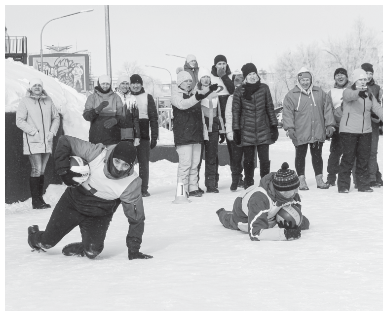
Только бы доползти