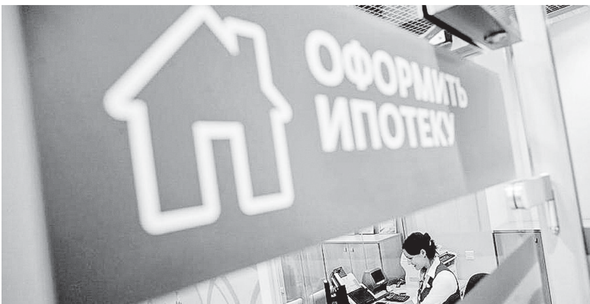
Срок действия кредитного решения по новым заявкам в Сбербанке теперь составляет 30 дней, вместо 90