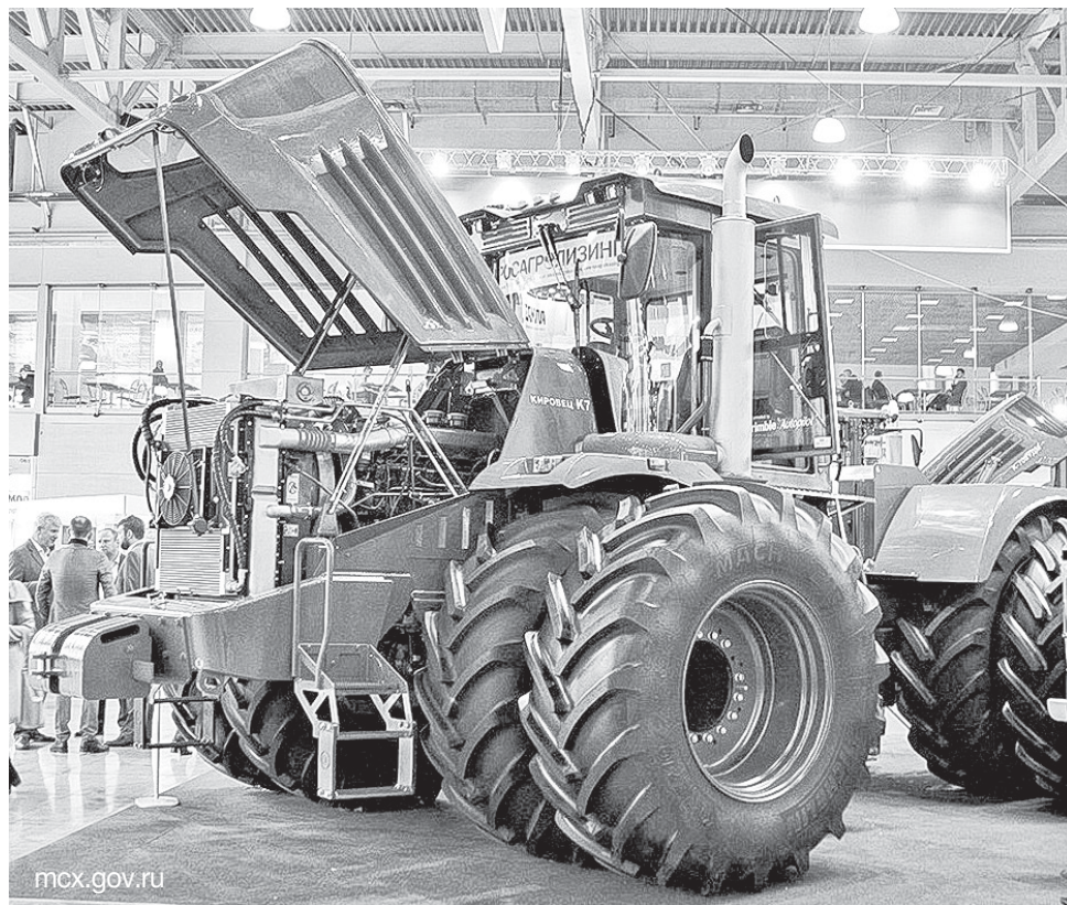
Более 470 единиц техники и оборудования приобрели оренбургские аграрии с начала 2022 года