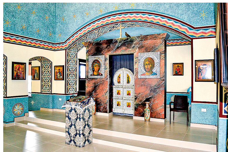
В храме во имя Иоанна Шанхайского и Сан-Францисского чудотворца