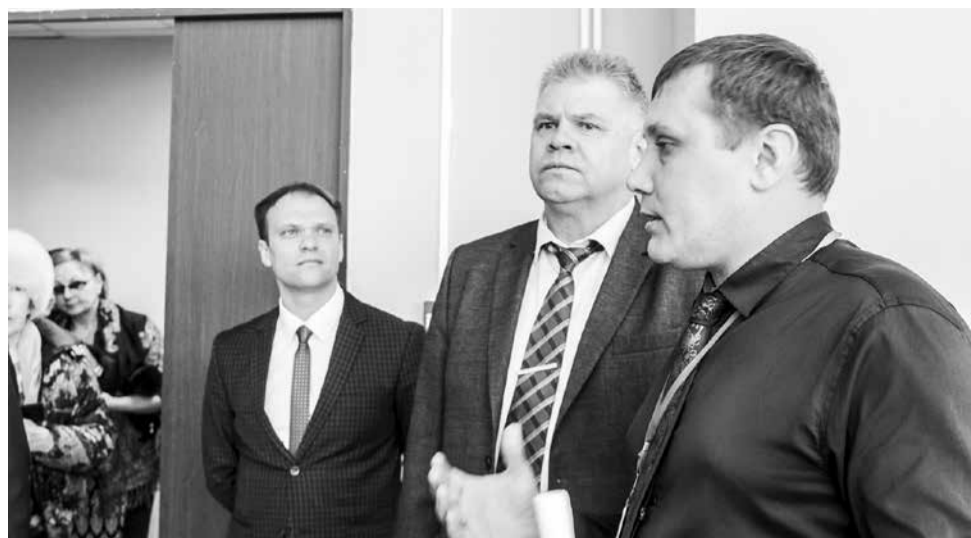
Директор спорткомплекса показывает здание

После осмотра здания в конференц-зале спорткомплекса прошла небольшая пресс-конференция. Кстати, из окон журналисты