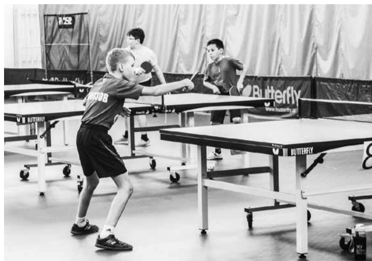
Идет тренировка по настольному теннису

После этого журналистам показали, как про-