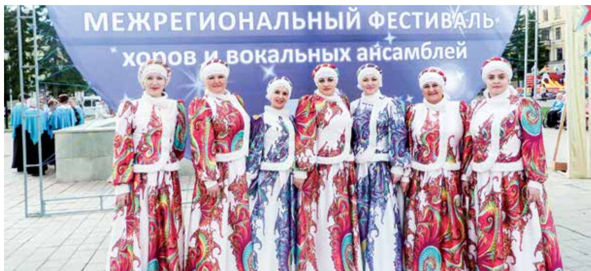
«Сударушка» на Межрегиональном фестивале «Звёзды Белоречья»

Первым конкурсом, на который мы поехали все вместе, была «Русская песня» в городе Оренбурге. «Сударушка» исполнила две композиции «Калина-рябина» и «Кони». Выходя на сцену, жутко переживали, но когда зазвучала фонограмма, мы собрались и исполнили песни на одном дыхании. Мои девочки справились с поставленной задачей блестяще. На этом конкурсе они меня удивили собранностью – во время выступления внезапно пропала фонограмма, но они продолжили петь, уверенно держали партии и не сбились. Поверьте, в