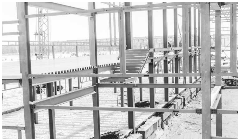
Каркас будущего ледового дворца