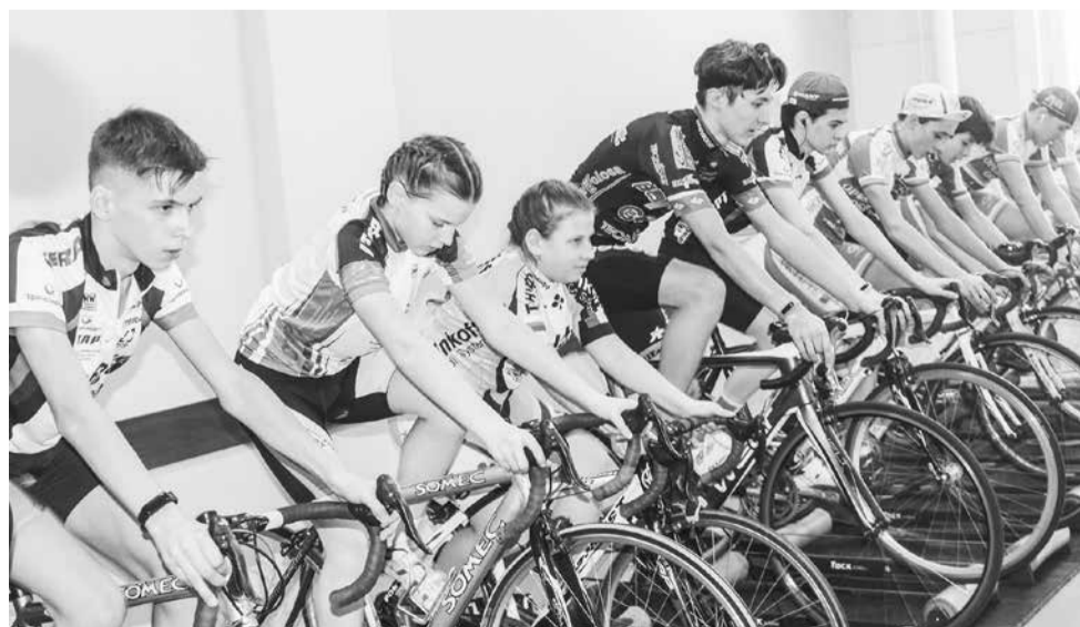
Зимой велосипедисты накручивают километры в зале