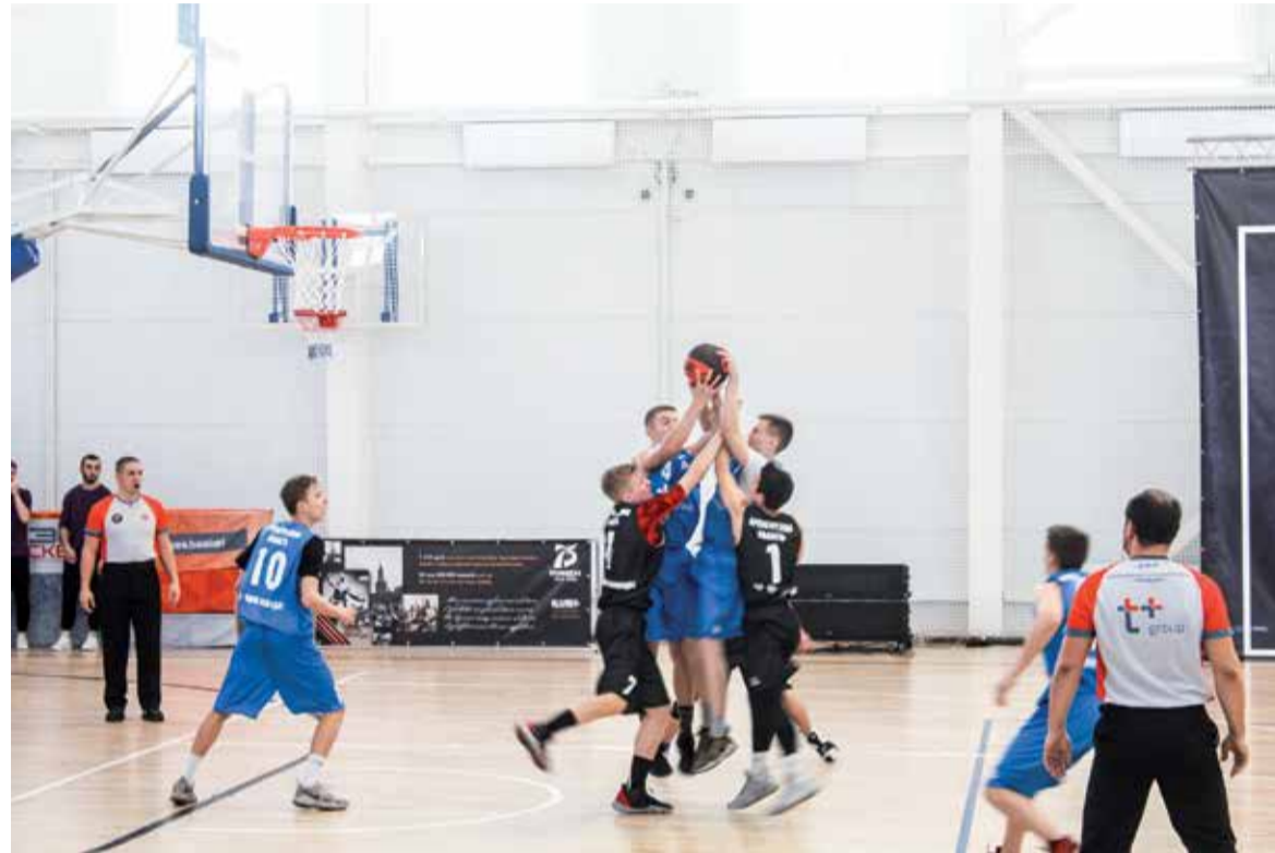
Сильная игра парней

играли в новом зале. Хорошие кольца, шикарный паркет. Помещение шире и просторнее того, в котором проходили соревнования раньше. Безусловно, каждый «КЭС-БАСКЕТ» запоминается знакомством с новыми людьми и полученным опытом. Лично мне интереснее всего было играть с командой из Оренбурга. Кроме этого вида спорта, я еще увлекаюсь волейболом, но баскетбол для меня всегда на первом месте. Мы не одержали победу, но будем стараться. Поработаем над защитой, над темпом игры, над тактикой нападения и быстрым отрывом.