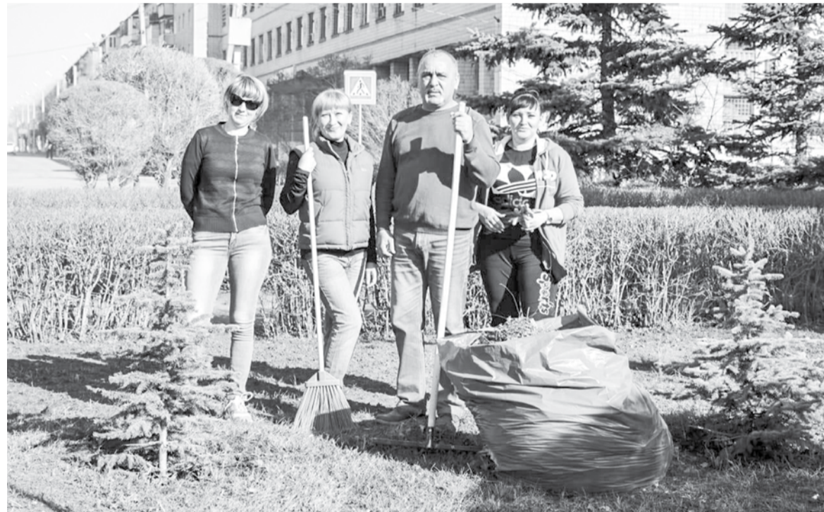
Субботник на центральной площади города Гая

- На текущий момент в округе работают несколько крупных предприятий: Гайский ГОК, завод ОЦМ, птицефабрика Гайская. Планируется открытие нового диабазового месторождения. В перспективе – еще один инвестпроект. Депутатский корпус в тандеме с главой округа, смотрящие с позитивом на развитие Гайского городского округа, заинтересованы в том, чтобы сделать эту территорию привлекательной для бизнеса. Необходимо открывать новые предприятия, чтобы уйти от монозависимости. Ведь все мы прекрасно понимаем: