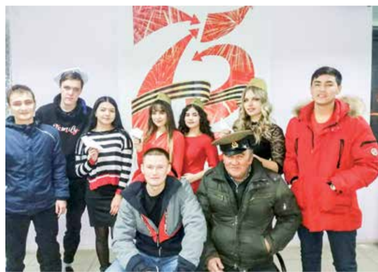
В Нововоронежском центре досуга