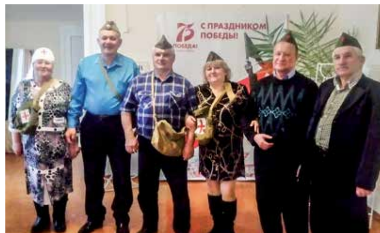
В Ириклинском центре досуга всегда интересно и весело