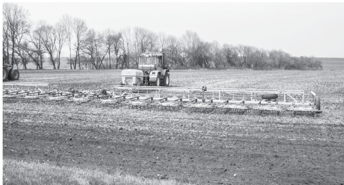
Приближаются весенне-летние работы в полях