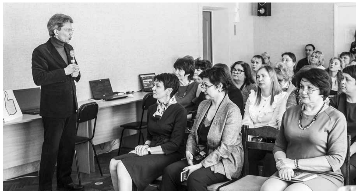
Педагогам показали, чему можно учиться в интернете