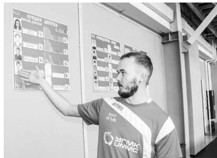
У юных теннисистов стимул - попасть в десятку лучших

могли наблюдать за строительством ледового дворца, который, по предварительным оценкам, обойдется Уральской горно-металлургической компании еще в 498 миллионов рублей.