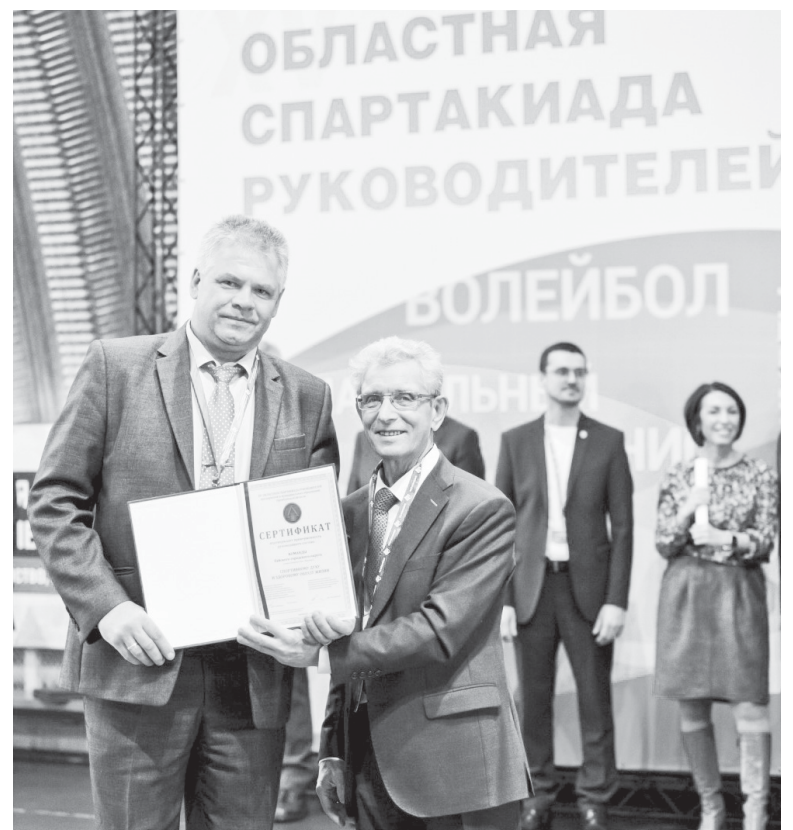
Гайский городской округ отмечен сертификатом приверженности руководящего состава к спорту