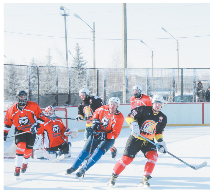
У ворот соперника