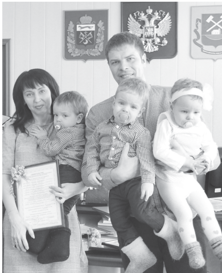
В семье Крышко растут тройняшки

В среду, 12 февраля, в администрации округа состоялось торжественное вручение молодым семьям свидетельств на получение социальной выплаты для приобретения жилья.