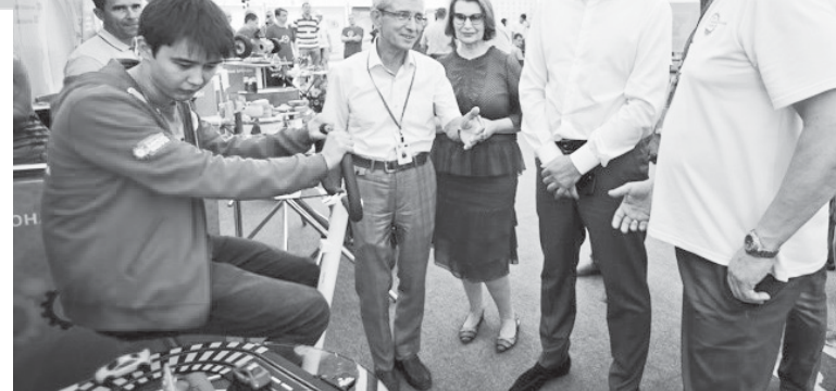
Губернатор Денис Паслер на форуме «Инженеры России»