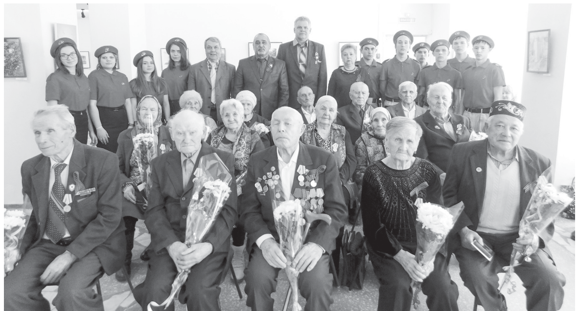
Фото с торжественной церемонии вручения юбилейной медали «75 лет Победы в Великой Отечественной войне 1941 - 1945 гг.»