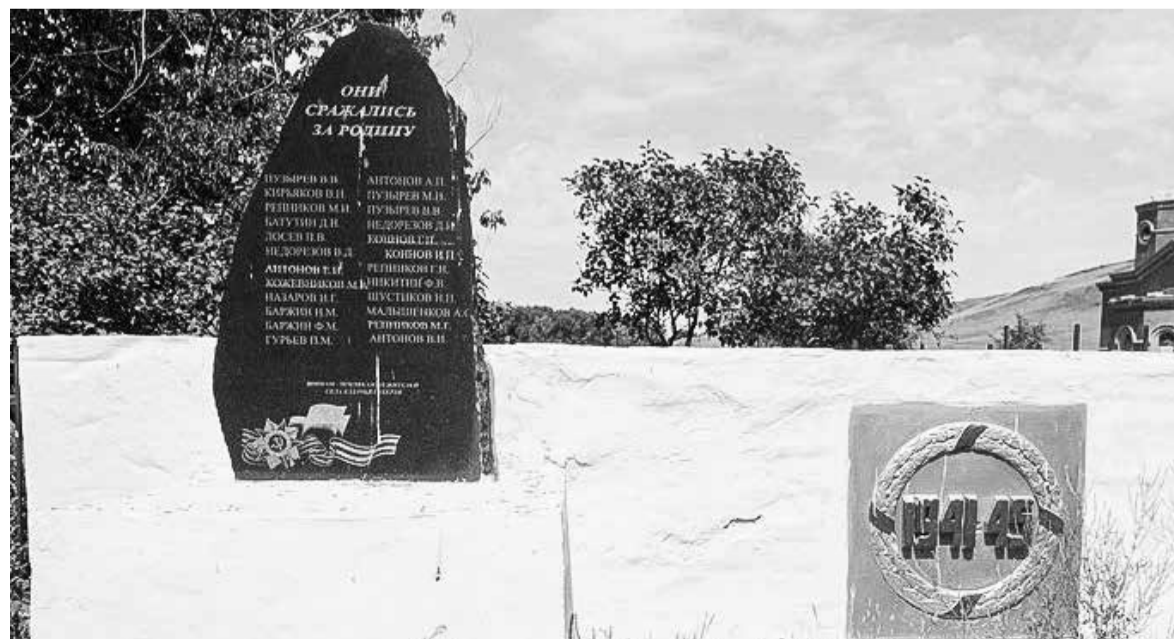
Памятник воину-победителю, установленный в честь 40-летия Победы в Великой Отечественной войне в 1941-1945 гг. в селе Казачья Губерля