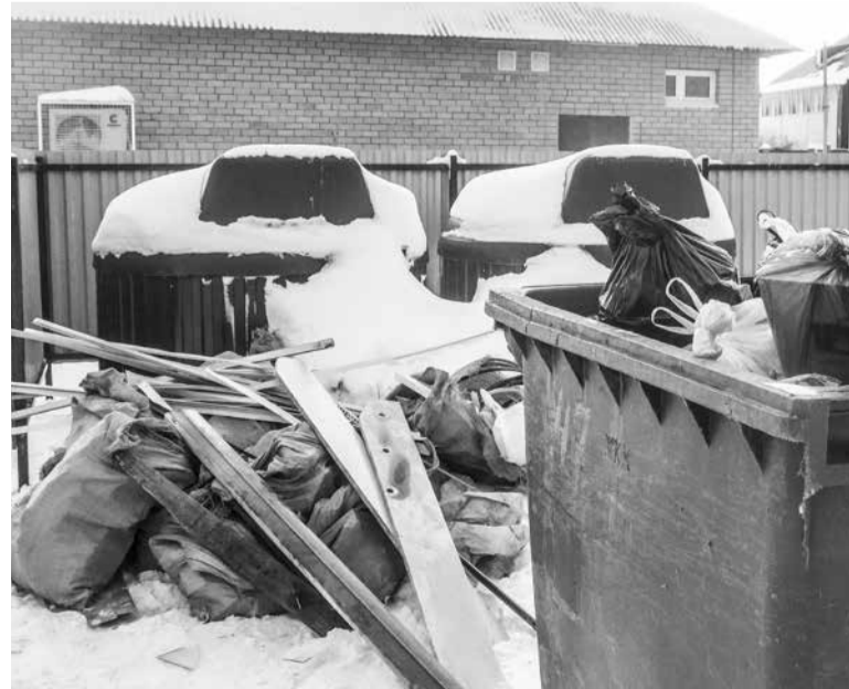
В числе первых заглубленные контейнеры появились на площадке возле домов №9а, 11, 11а по улице Декабристов. Сегодня они стоят неиспользуемые рядом с привычными стандартными наземными баками