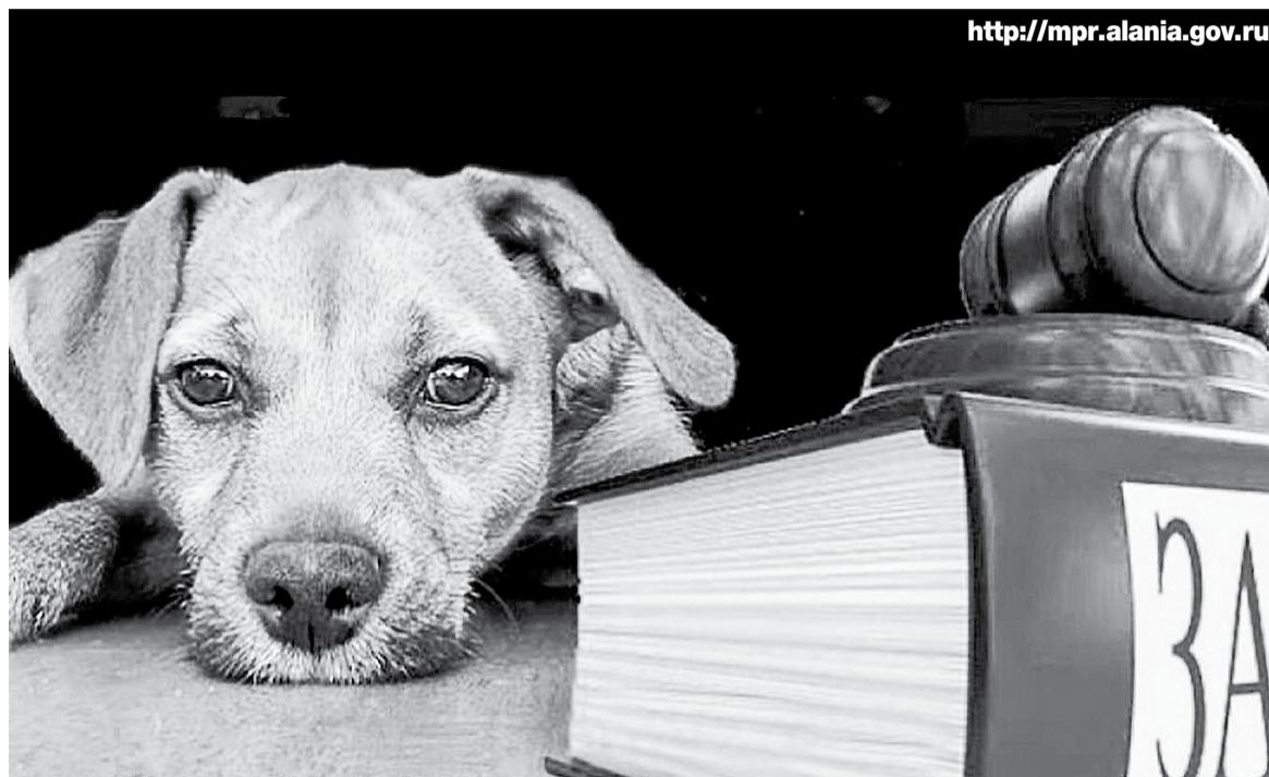
Ознакомьтесь с законом

Закон детально регламентирует требования к приютам для животных - они могут быть государственными, муниципальными