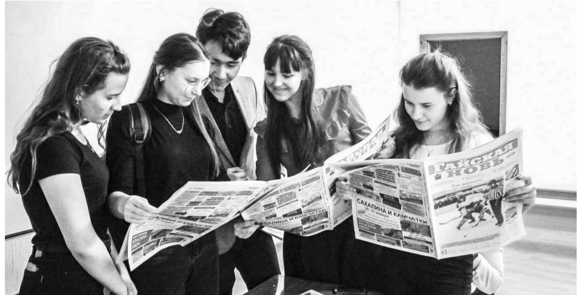
Школьники знакомятся со свежим выпуском газеты