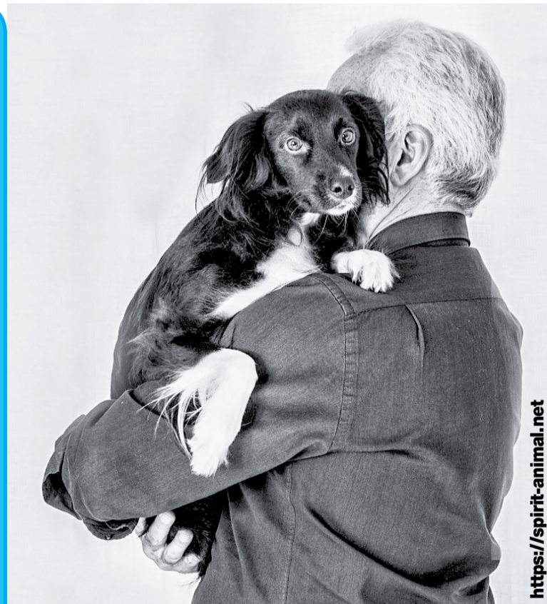
Давайте заботиться о друзьях

Владельцы приютов должны проводить осмотр, делать вакцинацию от бешенства и других опасных заболеваний, вести учет поступивших и выбывших питомцев, осуществлять стерилизацию, безоговорочно возвращать животных хозяевам, если на ошей-