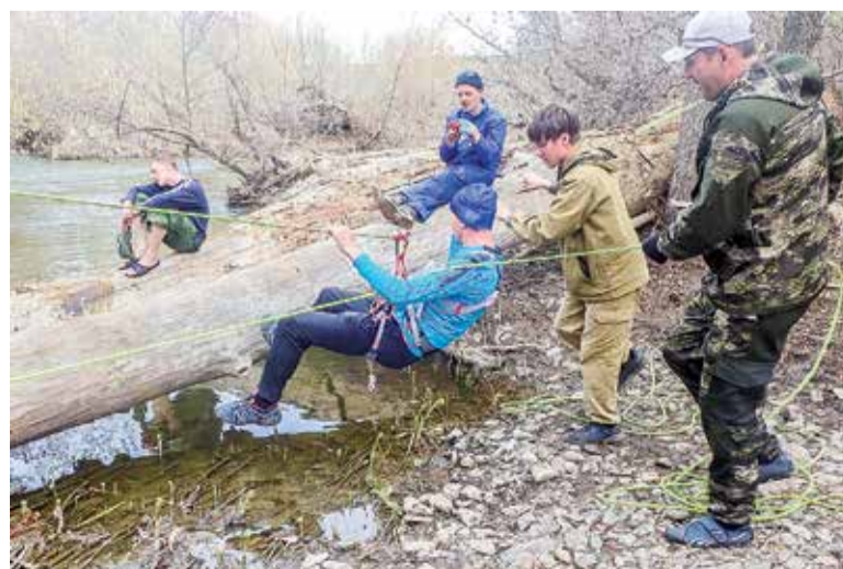
На прохождении веревочной дистанции