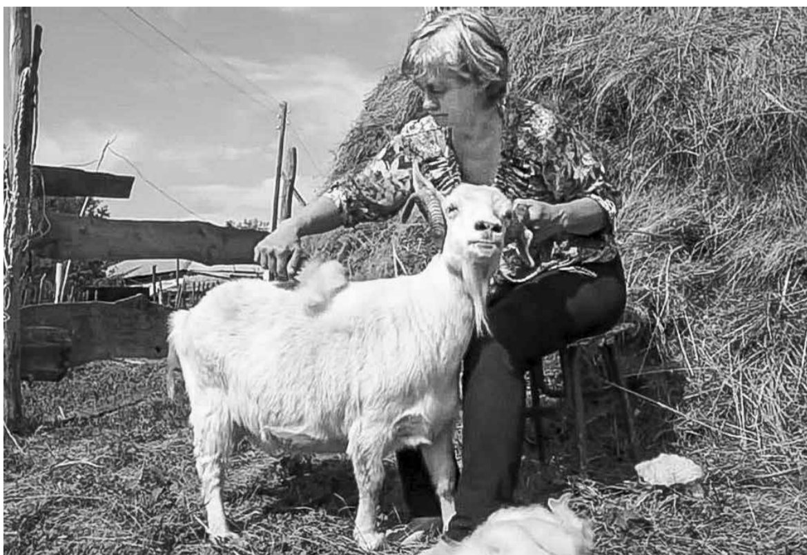
Пух оренбургских коз - мягкий, теплый