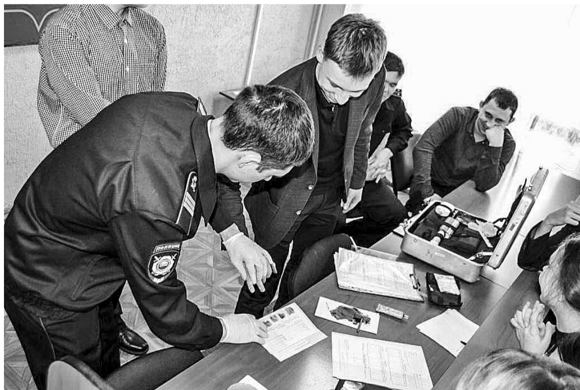
Отпечатки пальцев – уникальный код человека

заключается их работа, насколько она сложна и ответственна, отметив при этом, что она интересна и увлекательна. Юные гости с большим вниманием слушали, как действует эксперт-криминалист на месте происшествия, поняли, что такая работа требует аккуратности и усидчивости, любознательности и исследовательских способностей.