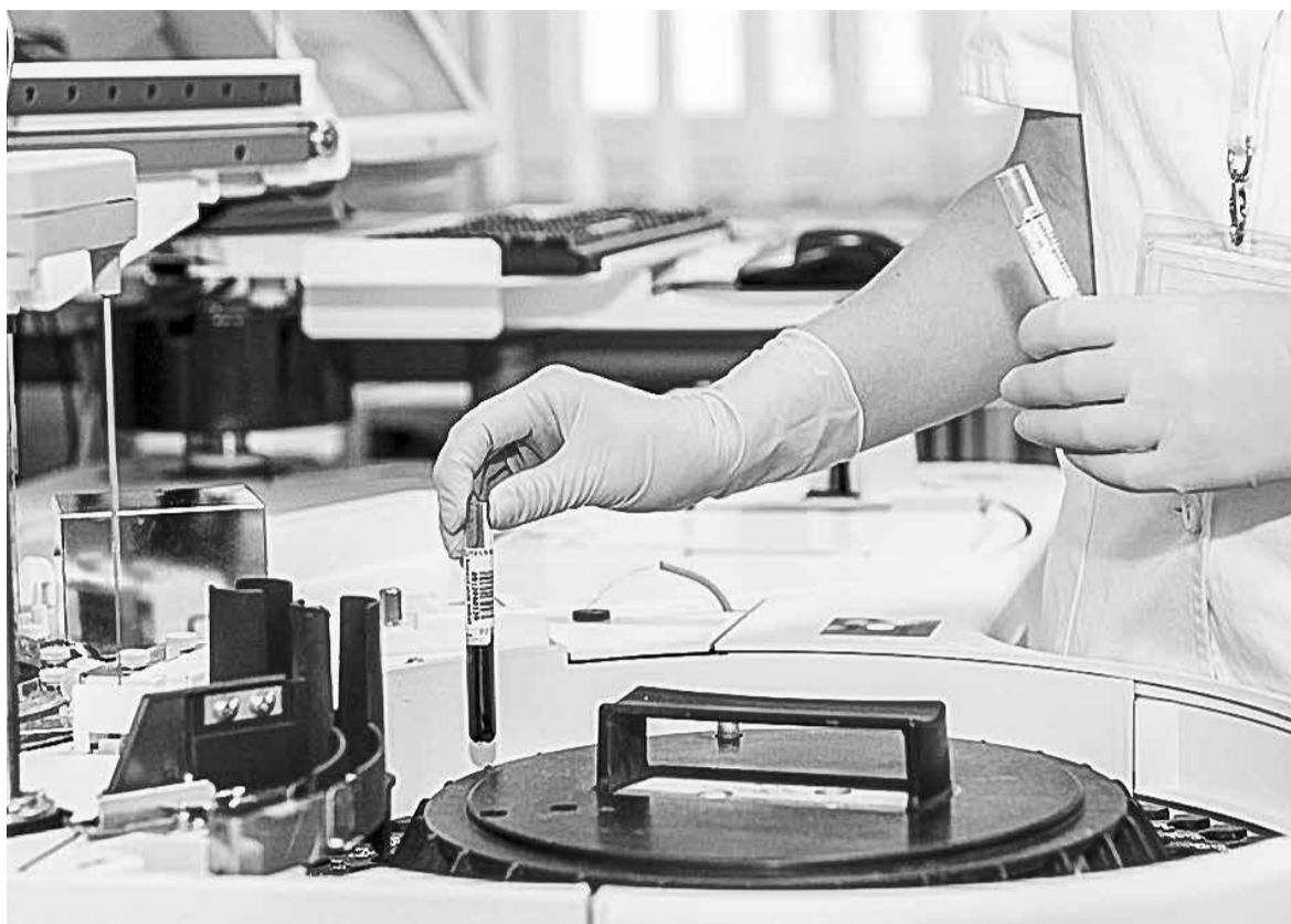
В Оренбуржье заработали центры амбулаторной помощи онкобольным

Он призвал глав районов как можно скорее заняться сбором необходимых документов и регистрацией погостов. Тем более что область сделала все, чтобы мак-