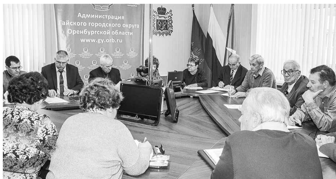
Идет очередное заседание старейшин

На сегодняшний день администрация городского округа тесно взаимодействует с советом ветеранов, старшее поколение ежегодно принимает участие в