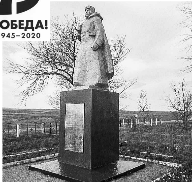
Памятник «Воинам-землякам» в селе Камейкино