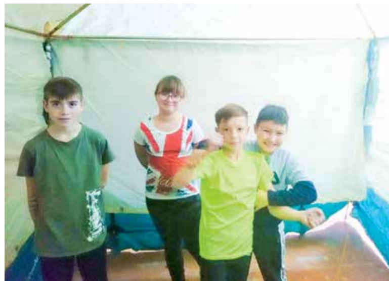
На тренировке: научились ставить палатку!