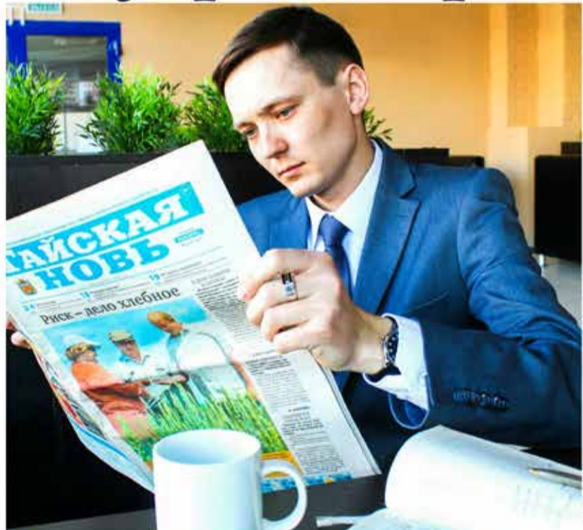
Цены действительны на момент выхода рекламы.