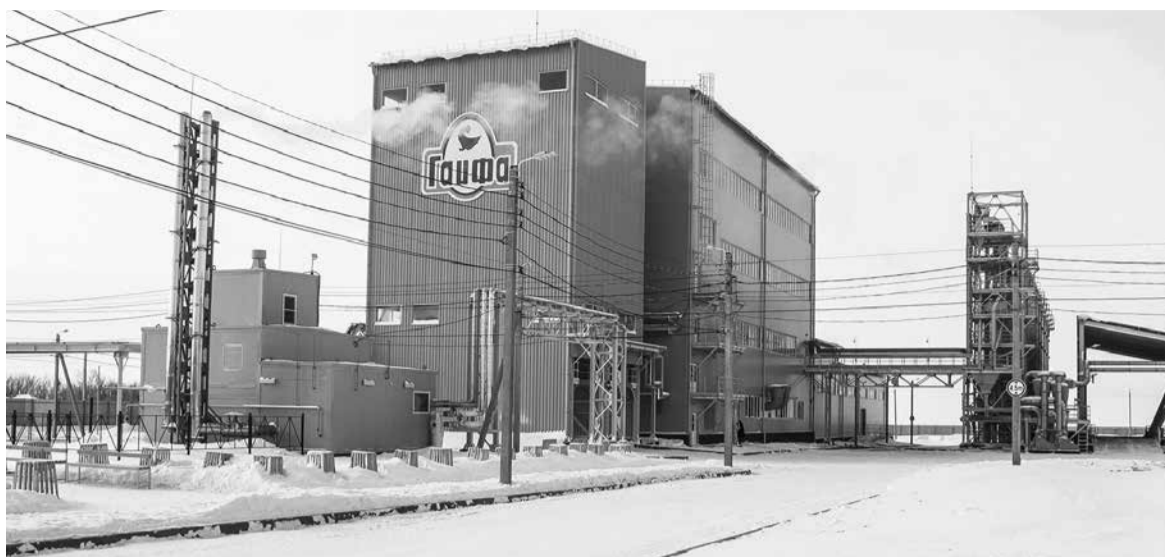
Стоимость строительства комбикормового цеха – 585 миллионов рублей, в том числе стоимость оборудования – 189 миллионов рублей

Два года назад началась реализация этой задачи: найден исполнитель работ – компания ТЕХНЭКС (г. Екатеринбург), закуплено оборудование, проведены все необходимые документальные работы, выбран подрядчик, а в 2018 году буквально на глазах гайчан в чистом поле выросло высокое здание цеха, – рассказал журналистам