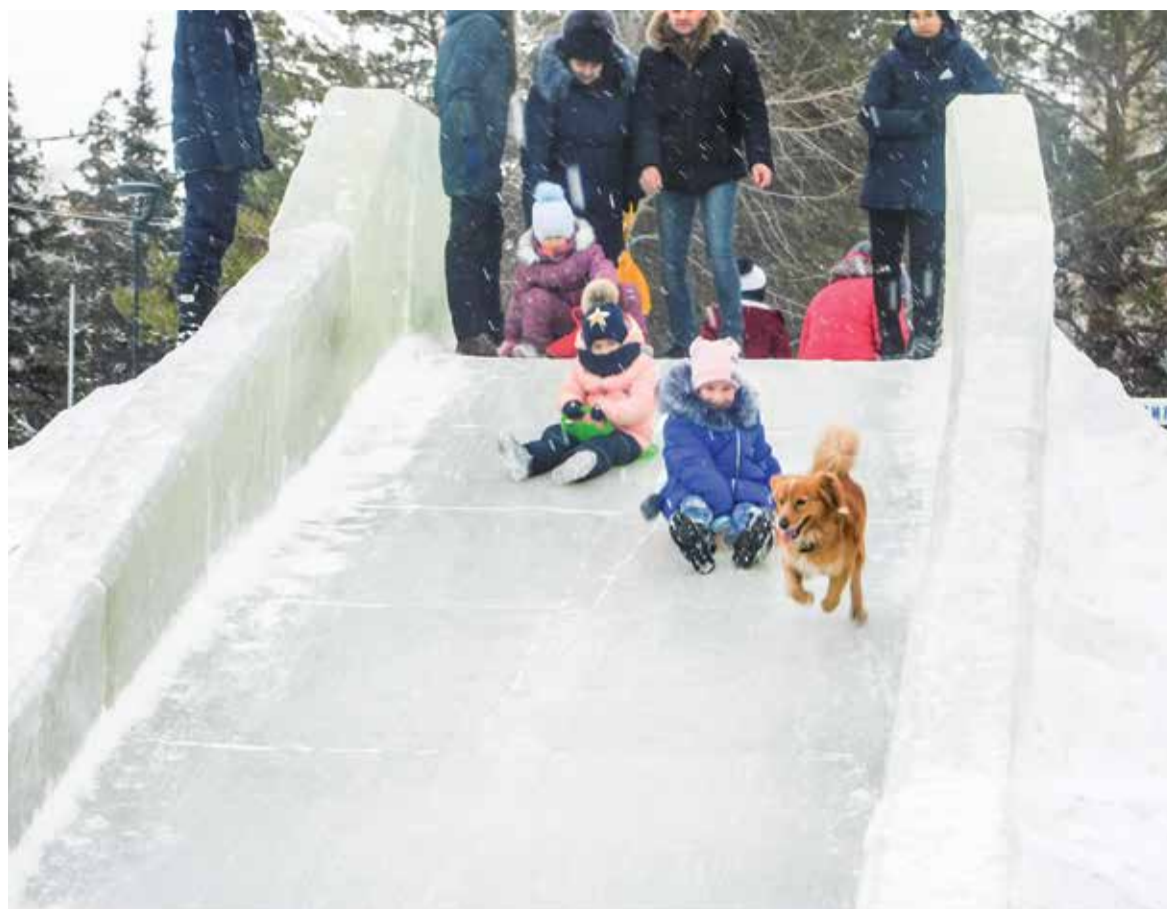
С горки весело качусь!

Программа соревнований включала в себя упражнения по общей физической подготовке, входящие в нормативы испытаний (тестов) ВФСК «ГТО»: подтягивание из виса на высокой перекладине, прыжок в длину с места толчком двумя ногами, челночный