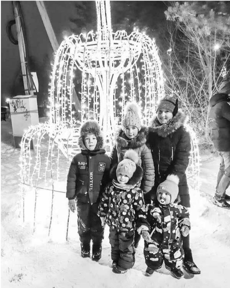
Такой фонтан нам по нраву!