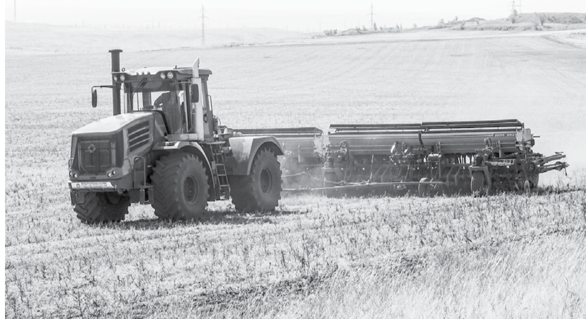
Идет сев озимой пшеницы на полях Гайского городского округа