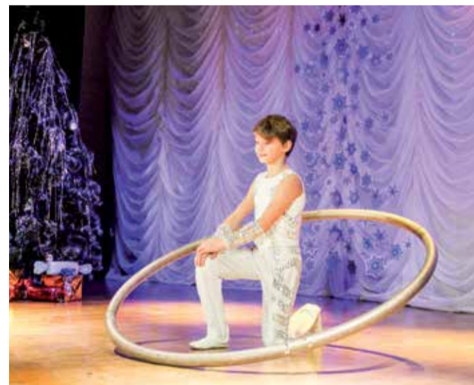
На сцене - цирк «Руслан и Людмила»

- Меня пригласили как баскетболистку. Баскетболом я занимаюсь уже пять лет, пришла в него из спортивной гимнастики. Мне нравится этот активный и динамичный вид спорта, в котором нужна сосредоточенность, точность движений и умение играть в команде, а от победы или поражения отделяют какие-то секунды. В минувшем году мы приняли участие в городских соревнованиях по баскетболу. Вскоре нам предстоит выступить на областном чемпионате, к которому мы сейчас готовимся. Будет ли моя дальнейшая жизнь связана с этим видом спорта, пока не знаю, но то, что он помогает поддерживать себя в хорошей физической форме, это уже отлично.