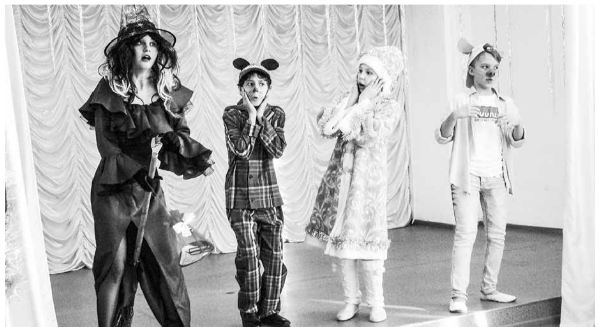
«Каждый может стать Дедом Морозом»