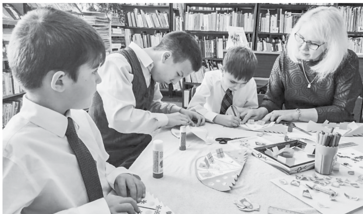
Украшения для елки ребята делают сами