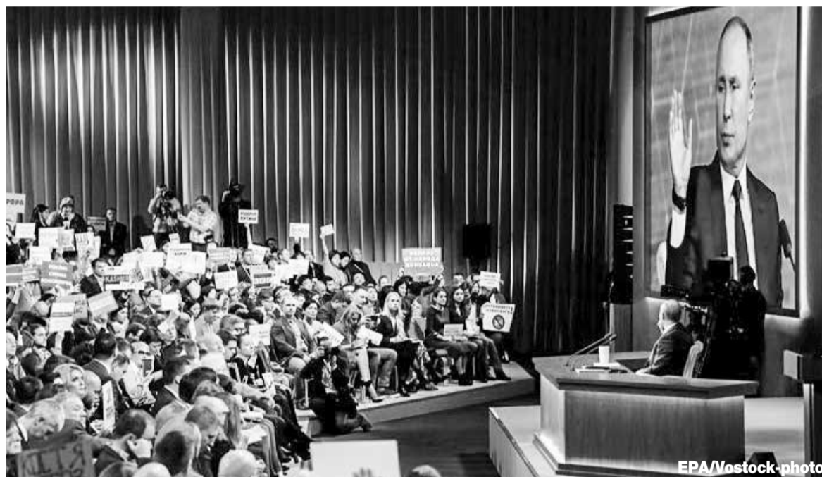
Президент за 4 часа 20 минут ответил почти на 80 вопросов журналистов

Мы целую систему мер наметили и за первого ребёнка, материнский капитал, расширили возможности использования материнского капитала, внесли изменения в то, что касается получения пособия. Раньше у нас было полтора прожиточных минимума на члена семьи, тогда люди имели возможность на получение пособия, теперь мы расширили до двух прожиточных минимумов. Это резко увеличило количество получателей этой льготы. И там целый набор. Но всё равно мы смотрим за тем, что мож-