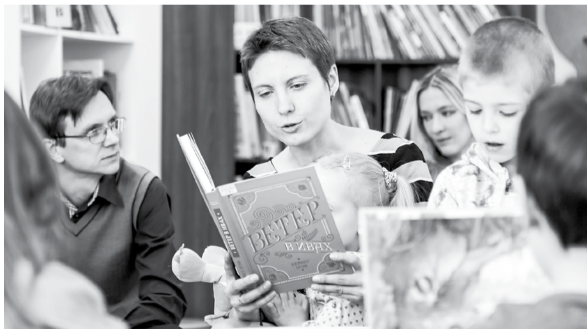
«Мармеладный день» и вкусный, и интересный