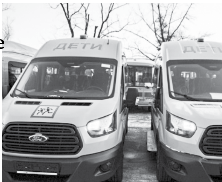
Новые школьные автобусы

– Перед нами стояла задача по существенному обновлению школьного автопарка, для того чтобы наши дети ездили на красивых, комфортных, безопасных автобусах. И эту задачу мы выполнили: я бы даже сказал, рекордно обновили наш парк. В этом году школы области получили 105 новых автомобилей. Это – заключительная партия в 2019 году. Сегодня школьный автопарк Оренбургской области стал одним из лучших в стране. Я езжу по районам и селам и вижу, насколько трепетно относятся к этим машинам. Не сомневаюсь, что и эти автомобили будут долго служить на благо наших детей, чтобы они чувствовали нашу заботу. Поздравляю вас с получением новых автобусов и желаю вам хорошей дороги по пути домой и на все время работы на школьных маршрутах, – обратился Денис Паслер к участникам мероприятия.